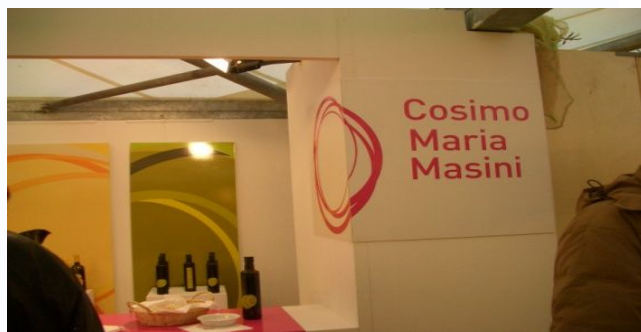
この時はサンミニヤートで白トリュフのお祭りでした