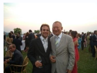
昨年7月のウェディングパーティーは、お昼から翌日の朝まで延々と続きました・・・