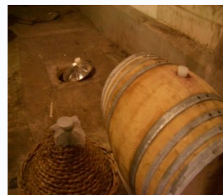
デザートワインのための葡萄や、樽や、昔スタイルの貯蔵庫